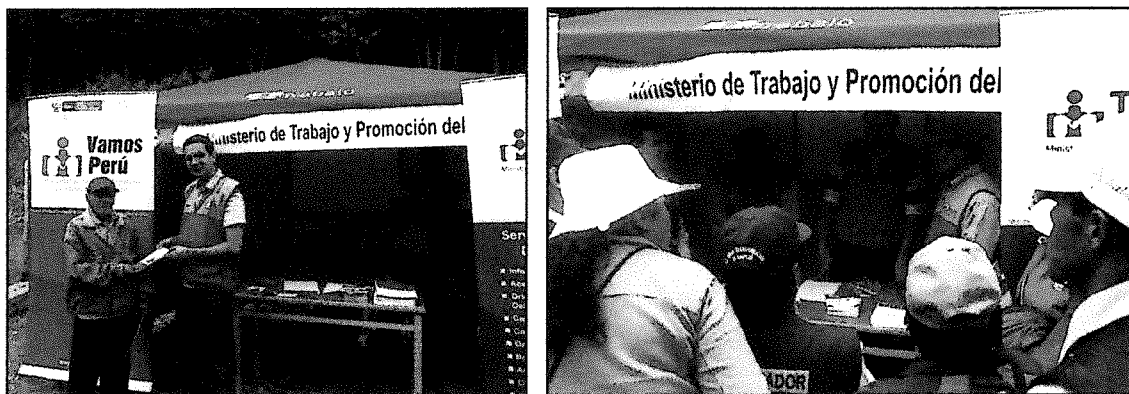
Personal de la VUPE La Libertad informando a la población de Ticapampa sobre los servicios de empleo

En total se han realizado 23 eventos de promoción. A fines de enero se realizó el último evento, en el distrito de Sarín, provincia de Sánchez Cerro en la región La Libertad, donde se difundieron los servicios de la VUPE durante la inauguración del Tambo de Ticapampa.